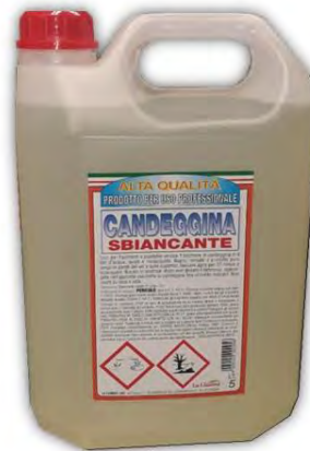
CANDEGGINA (ipoclorito di sodio) 0,5%

SE VUOI UTILIZZARE PRODOTTI DIVERSI DEVI FARTI ATTESTARE PER ISCRITTO DAL PRODUTTORE / FORNITORE CHE HANNO CARATTERE VIRUCIDA NEI CONFRONTI DEL CORONAVIRUS SARS-COV 2