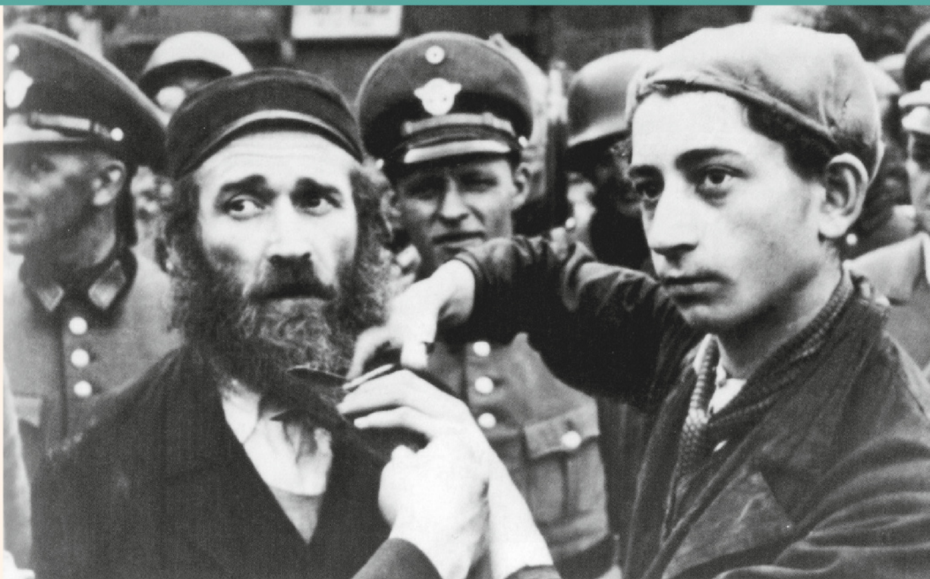
Un ragazzo viene obbligato dai nazisti a tagliare la barba del padre, barba che nella cultura ebraica è simbolo di autorità e di saggezza.

Éva Heyman , che era ungherese, visse l'occupazione tedesca in un periodo successivo rispetto a Moshe, Dawid o Yitskhok, perché la Germania invase il suo Paese nel 1944. Ecco cosa ci racconta: