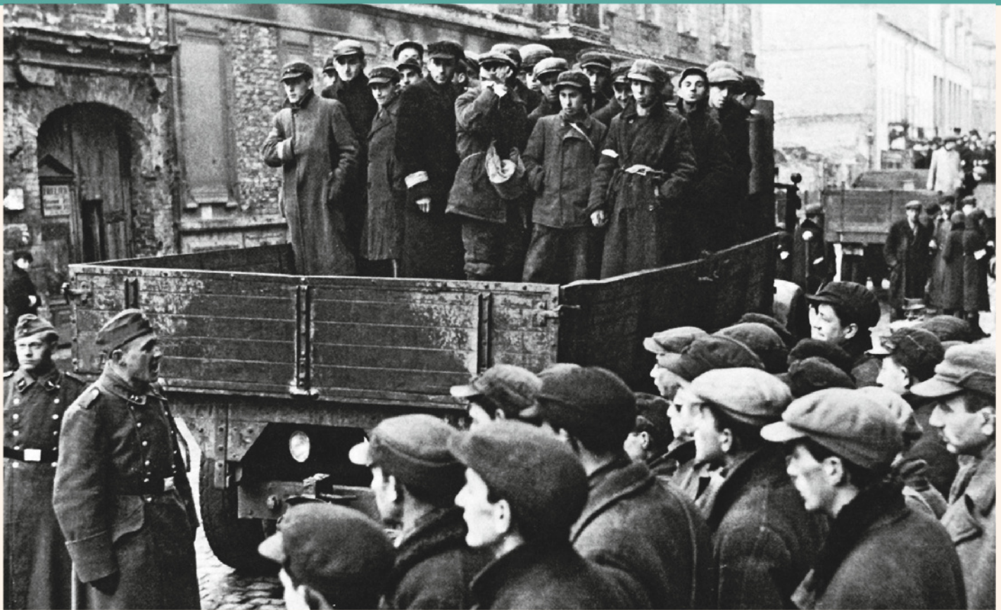
La deportazione degli ebrei del ghetto di Varsavia verso i campi di sterminio nel 1943.